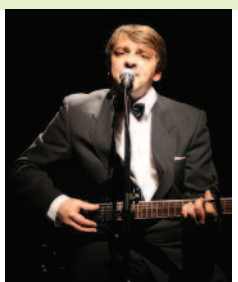
23. april, 17:00 Kako sem postal Slovenec